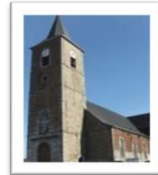
NOTRE DAME d'AYDE