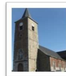
NOTRE DAME D'AYDE