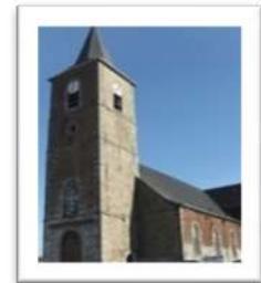
NOTRE DAME d'AYDE