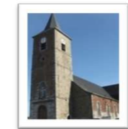
NOTRE DAME D'AYDE