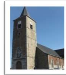
NOTRE DAME d'AYDE