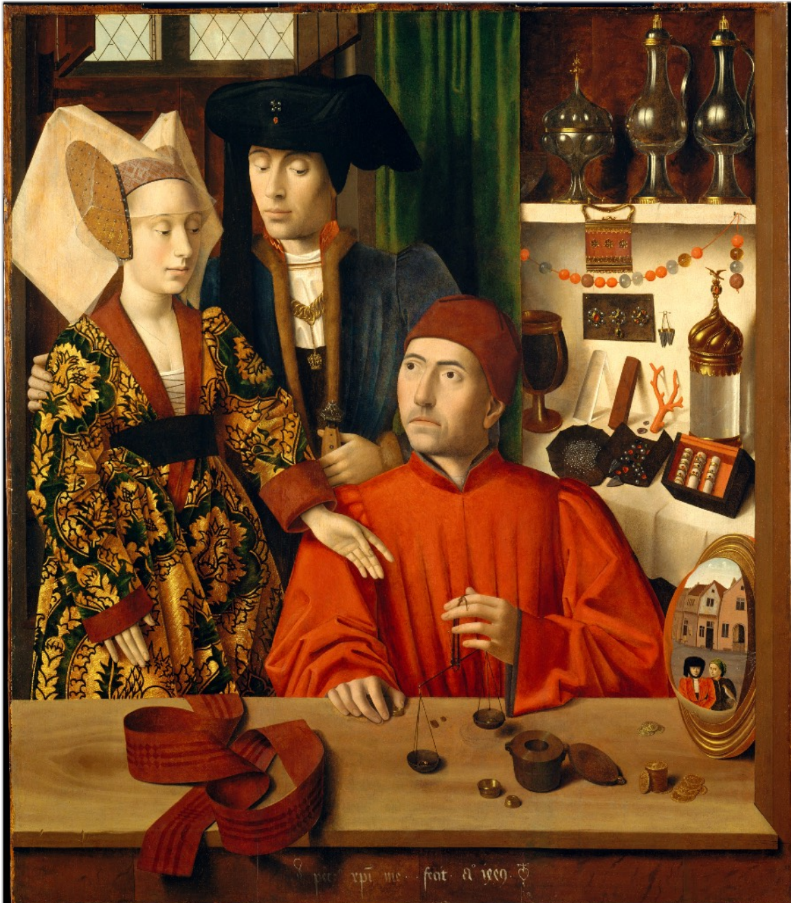
Petrus Christus, un orfèvre dans son atelier, 1449.

Après la fête de sainte Geneviève, patronne des gendarmes, le 26 novembre, suit de près celle de saint Éloi, patron à la fois des agriculteurs et des travailleurs de la métallurgie.