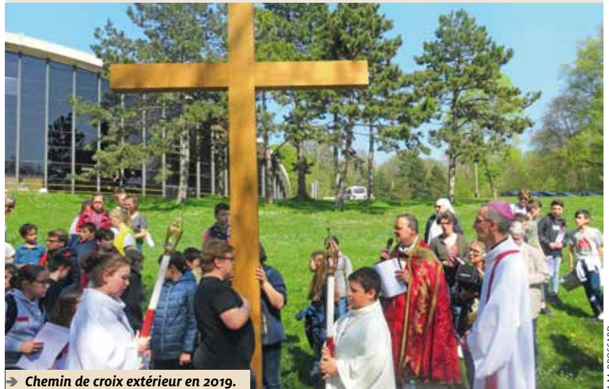
→ Chemin de croix extérieur en 2019.

Veillée à 20h à la cathédrale. Messes comme les samedis et dimanches ordinaires.