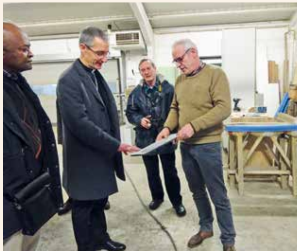
→ Visite de la menuiserie Grosfils à Doullers.