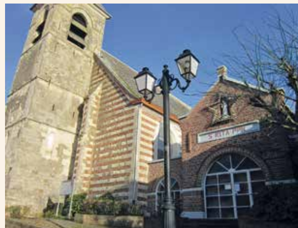
→ La chapelle Sainte-Rita à Curgies (près de l'église qui accueille près de quatre cents personnes les dimanches de la neuvaine, et deux à trois cents en semaine).

Le samedi 23 mai à 17h, nous accueillerons la Chorale des P'tits Bonheurs qui chantera en l'honneur de saint François d'Assise. Le concert sera suivi de la messe à 18h30.