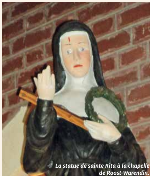
→ La statue de sainte Rita à la chapelle de Roost-Warendin.