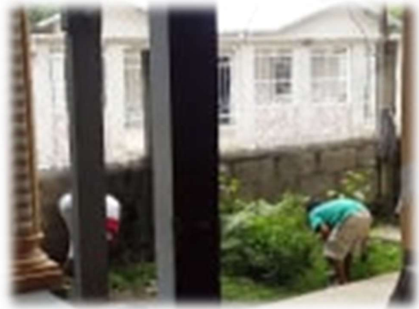
Nettoyage de l'herbe de jardin, afin de ne pas s'ennuyer dans cette quarantaine