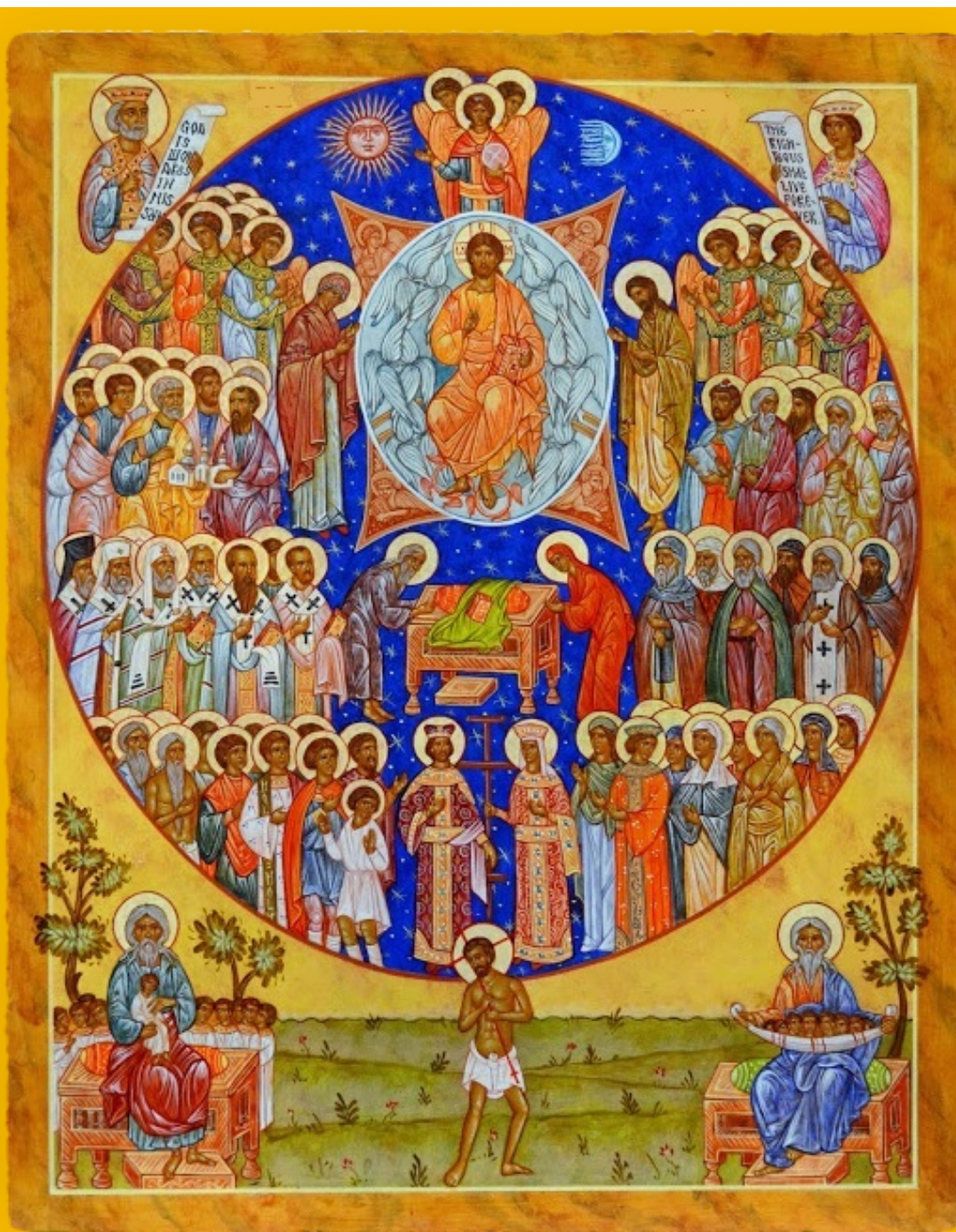
Icône des saints