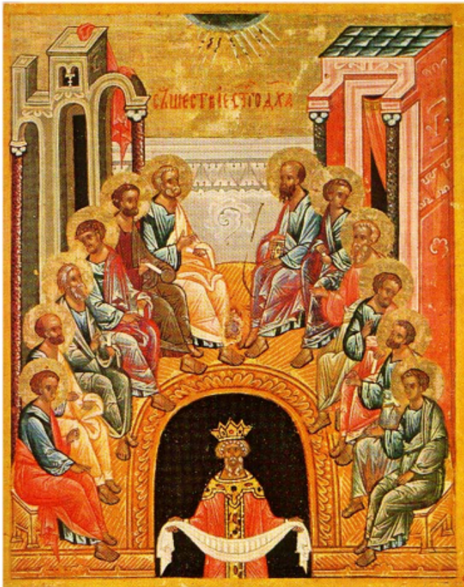
Icône russe Novgorod XVI e s

"Béni sois-tu, ô Christ notre Dieu, toi qui fis descendre le Saint Esprit sur tes Apôtres, transformant par ta sagesse de simples pêcheurs en pêcheurs d'hommes, dont les filets prendront le monde entier.