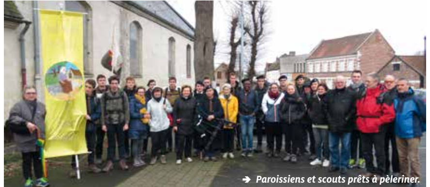
→ Paroissiens et scouts prêts à pèleriner.