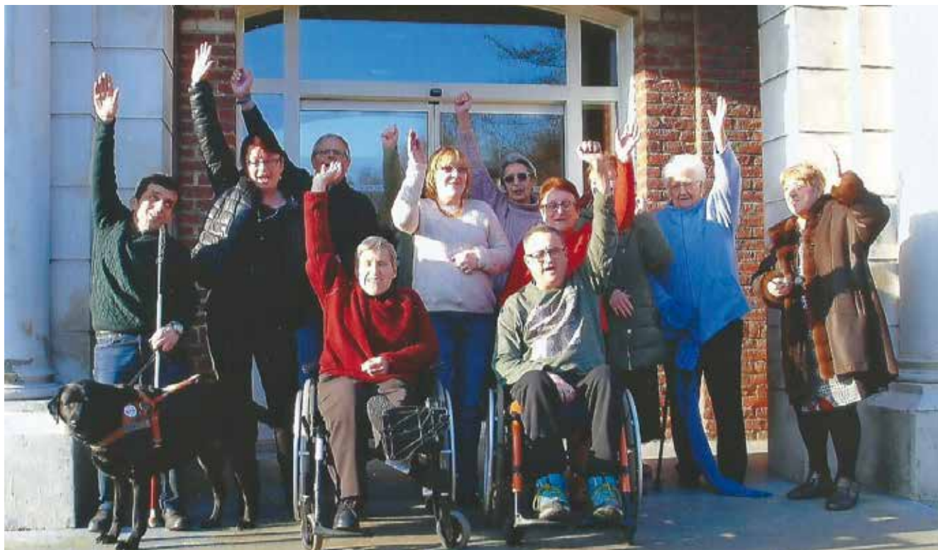
→ Le groupe de la Frat de Valenciennes.

La Frat est un mouvement reconnu par l'Église, dirigé et animé par des personnes malades chroniques ou handicapées physiques avec les groupes de la pastorale de la santé. Le but de ce mouvement est de créer la fraternité selon l'Évangile entre les personnes malades et handicapées qui peuvent ainsi, ensemble, sortir de l'isolement et développer le sens de responsabilité mutuelle et de la solidarité. « Dans le mouvement, nous voulons donner l'exemple que chacun reçoit et peut donner à son tour. La vraie fraternité se vit dans l'égalité et la réciprocité. »