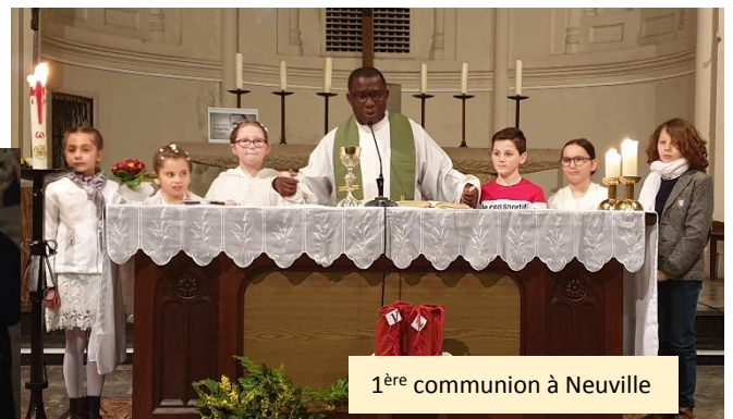
1 ère communion à Neuville