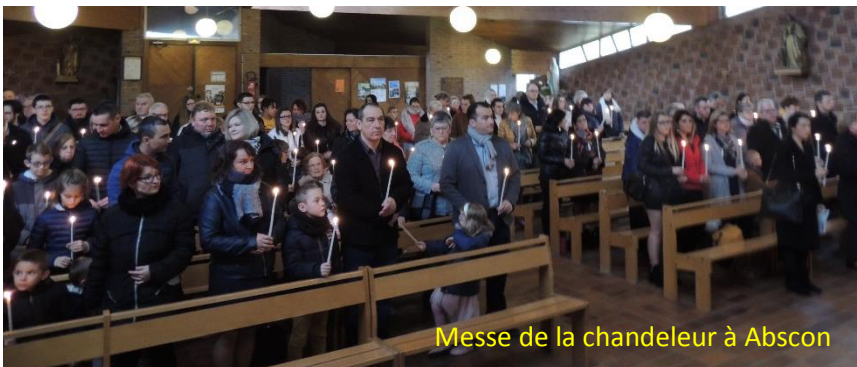
Messe de la chandeleur à Abscon