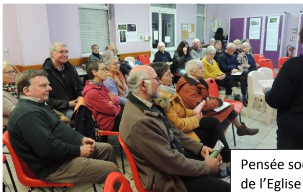
Pensée sociale de l'Eglise à Hasnon