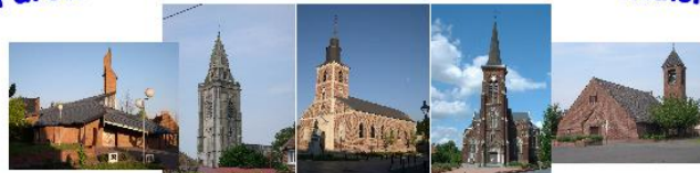
Abscon Escaudain Lourches Neuville Roelux