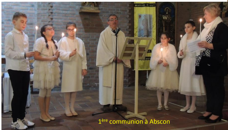
1 ère communion à Abscon