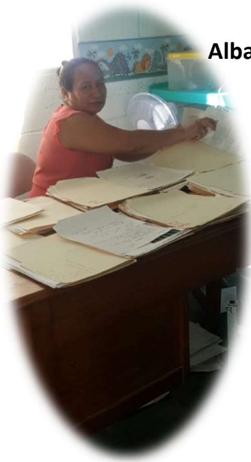
Alba Enfermera archibando en orden los expedientes de niños de consulta externa en seguimiento

En cambio de turno A al B dando indicaciones a seguir con los niños.