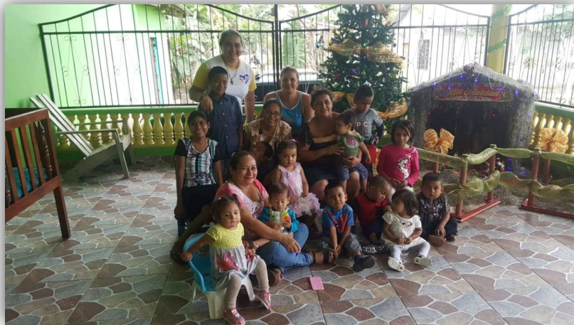
24 de diciembre 2019 despues de la piñateada una gran sonrisa.