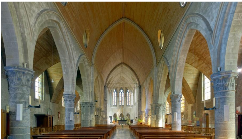
Valenciennes - église Saint Géry, construite pour les franciscains de 1225 à 1233