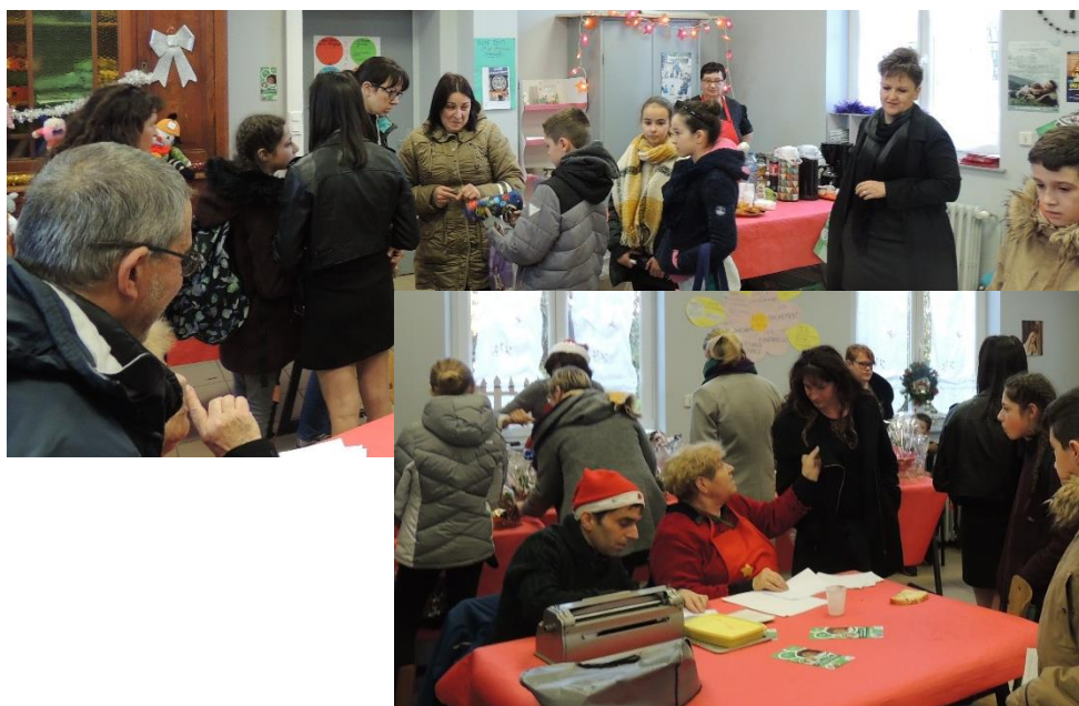
Opération « un cadeau pour moi, un cadeau pour lui » mini marché de Noël le 22 décembre à Escaudain