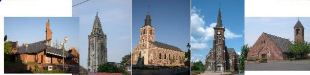
Abscon Escaudain Louches Neuville Roeux