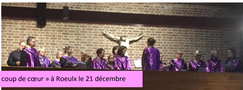
Chants de Noël par la chorale « coup de cœur » à Roelx le 21 décembre

Je réserverai le blanc pour les jours ordinaires et le noir pour ceux où tu seras absent. Je cimenterai le tout par la prière de ma foi et par ma confiance sereine en toi. Seigneur, je te demande simplement d'illuminer, de l'intérieur, ce vitrail de ma vie par la lumière de ta présence et par le feu de ton Esprit de vie. Ainsi, par transparence, ceux que je rencontrerai cette année, y découvriront peut-être le visage de ton Fils bien-aimé Jésus-Christ, Notre-Seigneur. » Amen