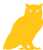
Table ronde Monde rural