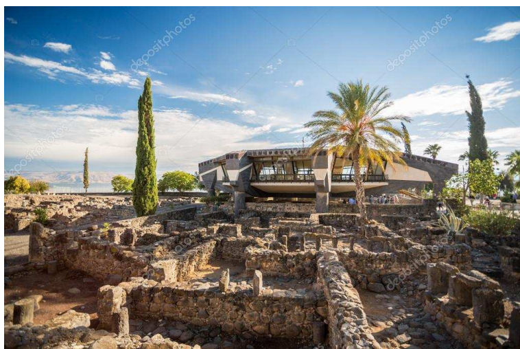
La Maison de Pierre à Capharnaüm

Montée au Mont des Béatitudes : temps de