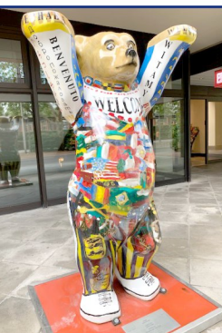
L'ours symbole de Berlin, décoré de multiples façons.