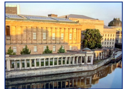
L'île aux musées symbole de l'unification de la ville, elle rassemble à présent, comme avant la guerre, les inestimables collections d'œuvres d'art de la ville.

Je suis revenue à Berlin presque 30 ans après, en juillet 2019, la ville est en pleine effervescence, cosmopolite et en mouvement. Aérienne, elle est traversée par de grandes artères bordées de verdure et est toujours en travaux. Du mur il ne reste aujourd'hui que quelques vestiges, authentiques ou reconstitués, destinés à perpétuer la mémoire des années de guerre froide. Mais ce mur est à la fois effacé et très présent en même temps.