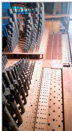
Photo du grand orgue existant avec ses 4 rangées de tuyaux