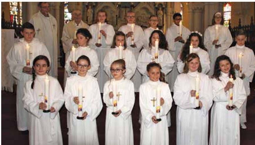
→ Le dimanche 12 mai, en l'église Saint-Amand de Dechy, dix-sept jeunes ont renouvelé leur profession de foi.