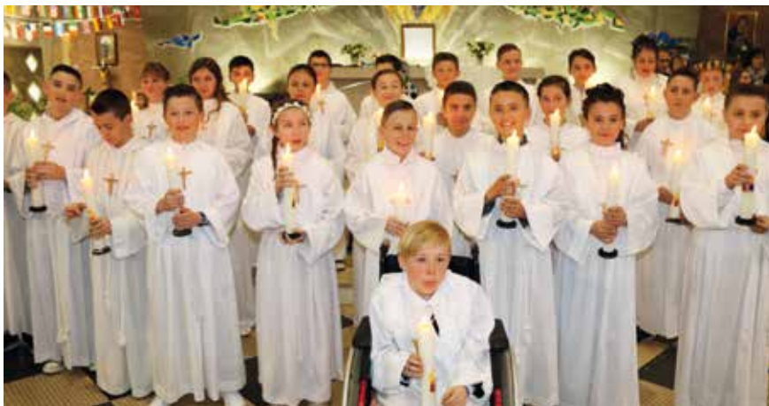
→ Le dimanche 5 mai, en l'église Saint-Sarre de Lambres-lez-Douai, vingt-six jeunes de la paroisse ont renouvelé leur profession de foi.

Les jeunes ont renouvelé en leur nom l'engagement pris pour eux par leurs parents, parrain et marraine à leur baptême. Ils étaient entourés de leur famille et des catéchistes.