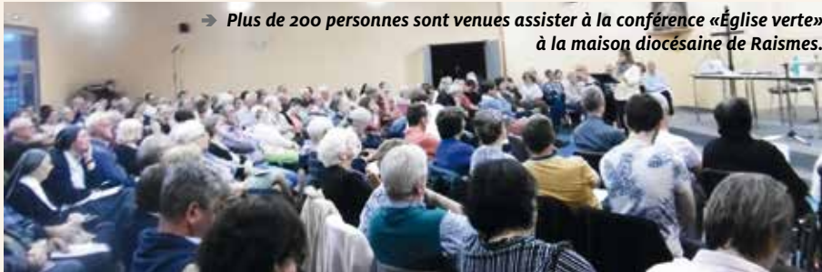
→ Plus de 200 personnes sont venues assister à la conférence «Église verte» à la maison diocésaine de Raismes.