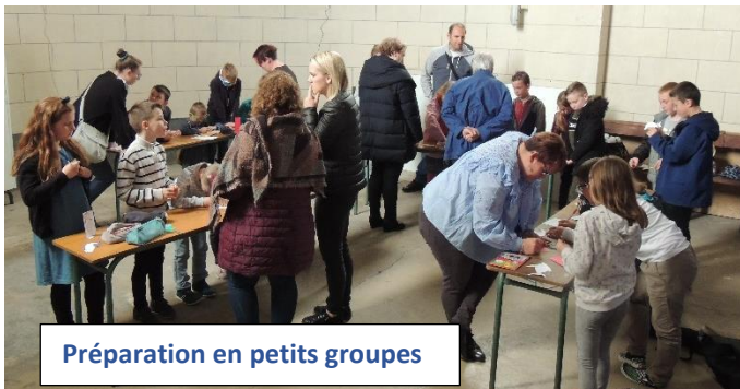
Préparation en petits groupes