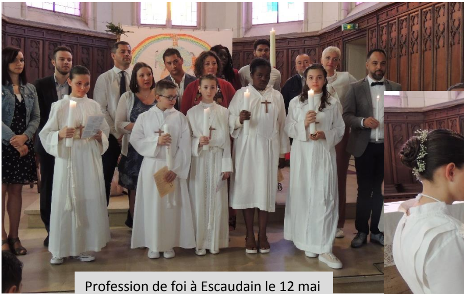
Profession de foi à Escaudain le 12 mai et baptême d'Andréa