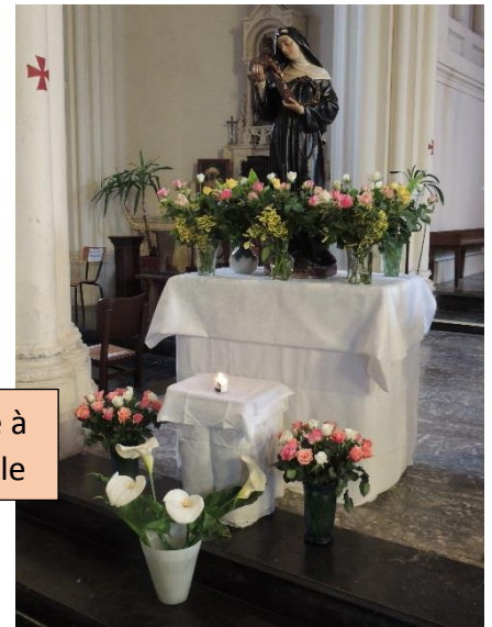
Fête de Sainte Rita célébrée à la messe du 26 mai à Neuville