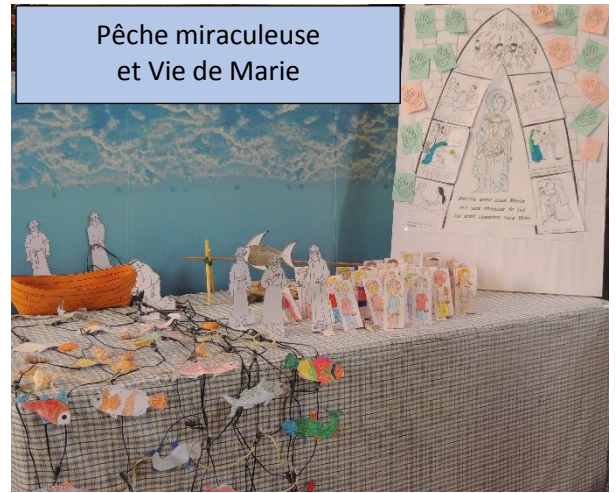
Pêche miraculeuse et Vie de Marie