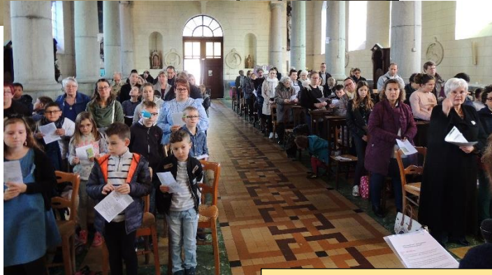
Célébration de la messe