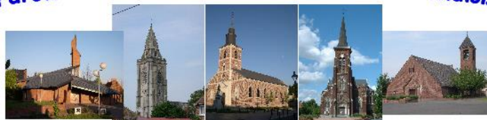
Abscon Escaudain Lourches Neuville Roeux