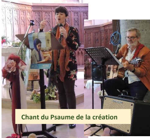
Chant du Psaume de la création