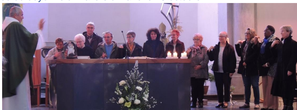
Bénédition des EAP et des membres des équipes funérailles