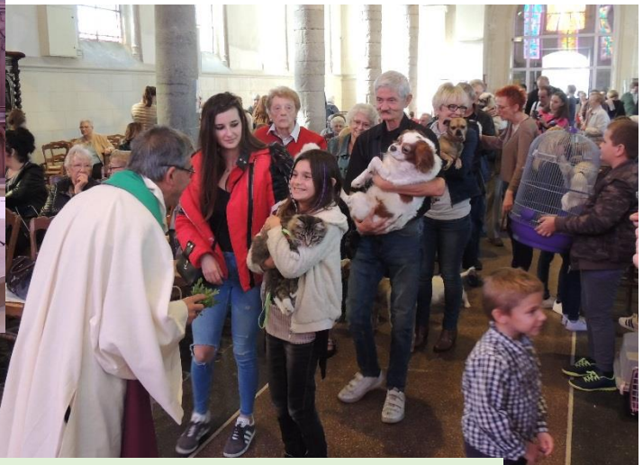
Bénédictio des animaux et de leurs maîtres