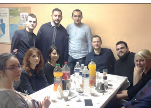
→ Toute l'équipe lors du bilan.