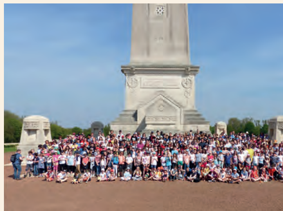
→ Les 400 collégiens devant le monument de Lorette.