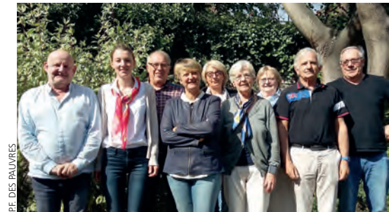
PE DES PAUVRES