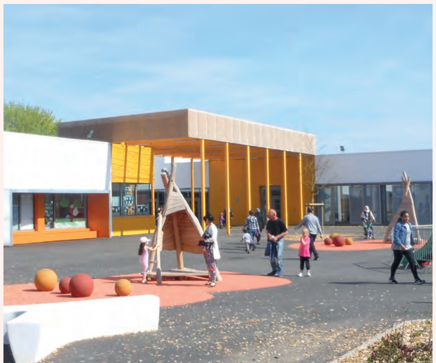
→ L'école maternelle.