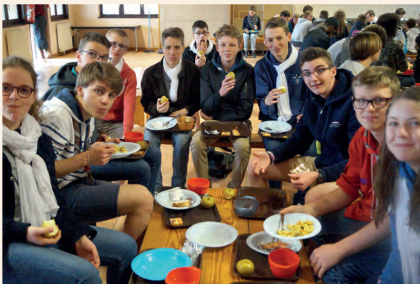
→ Un groupe de jeunes du diocèse de Cambrai à Taizé en avril dernier.

« On a pu parler sans tabou, discuter paisiblement de nos désaccords, les exprimer, apporter un regard franc et même critique, écrire un texte sans langue de bois qui a été transmis tel quel au Saint-Père. »