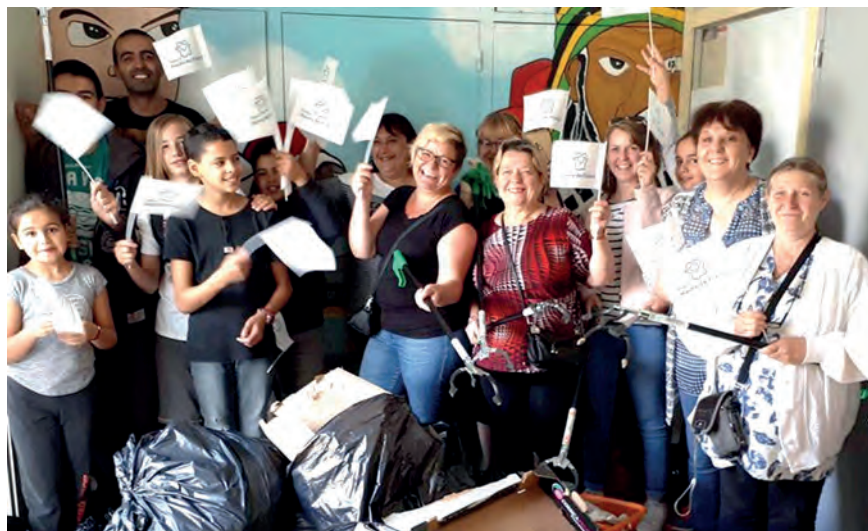
→ Une action propreté inter-génération.

Des enfants vont chanter dans une maison de retraite, des jeunes volontaires expliquent l'informatique à des retraités néophytes en la matière, des générations différentes planchent ensemble sur le sujet de l'éducation et agissent pour la propreté du quartier. Tous ces