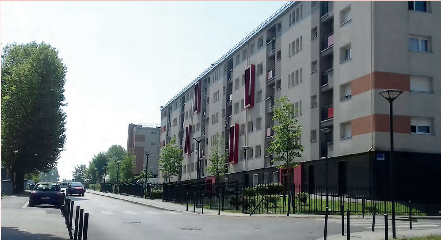
→ Rue Guy Naturel, à Denain.