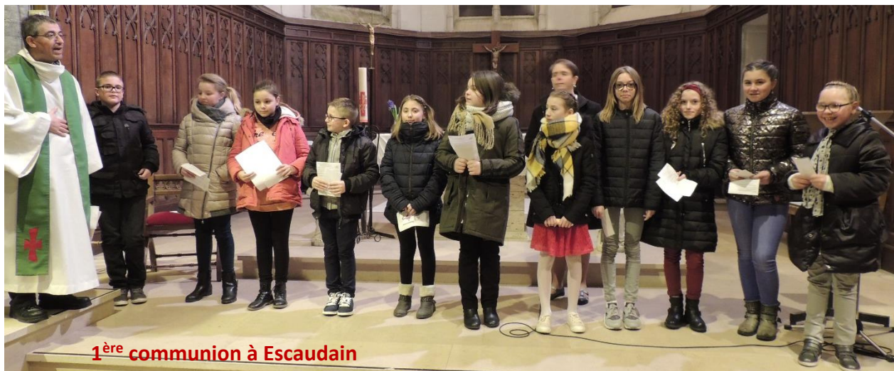
1 ère communion à Escaudain