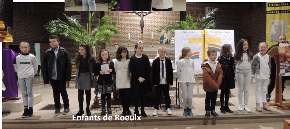
Enfants de Roelix