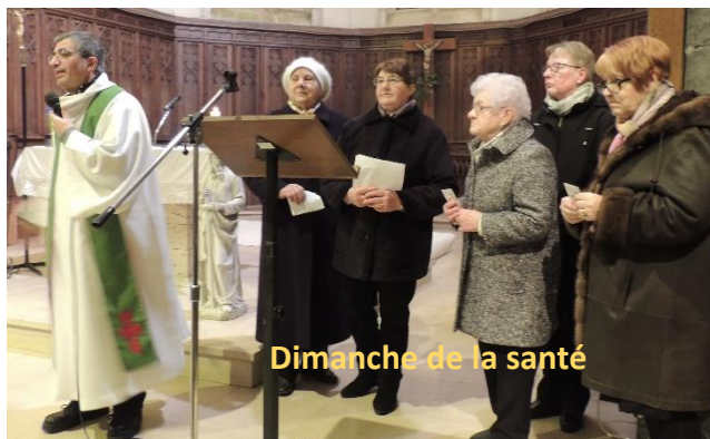
Dimanche de la santé