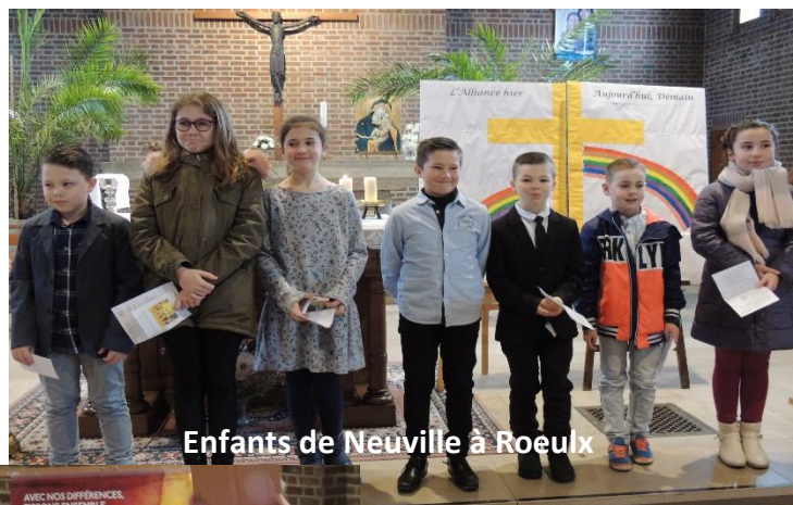
Enfants de Neuville à Roelix