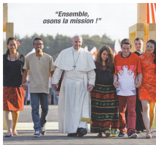
Semaine Missionnaire Mondiale du 15 au 22 octobre 2017