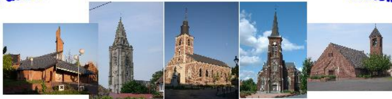
Abscon Escaudain Lourches Neuville Roeux