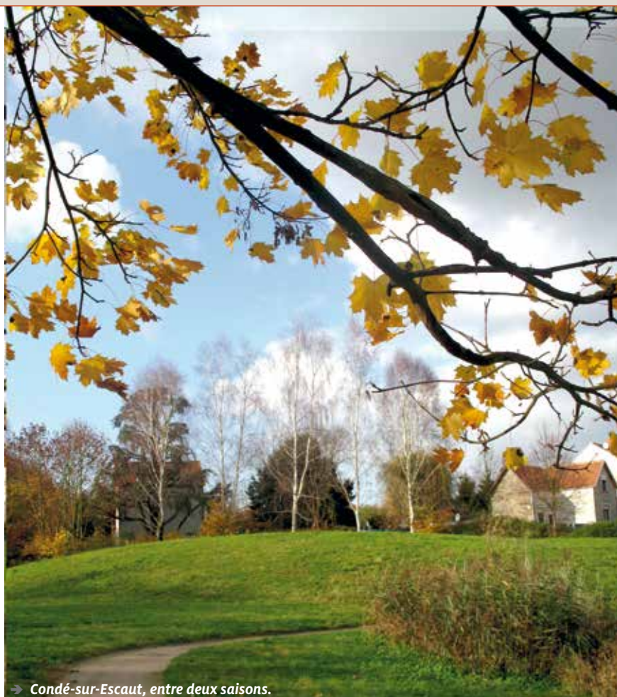
→ Condé-sur-Escaut, entre deux saisons.