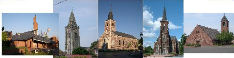
Abscon Escaudain Louches Neuville Roeux