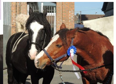
De nouveaux amis