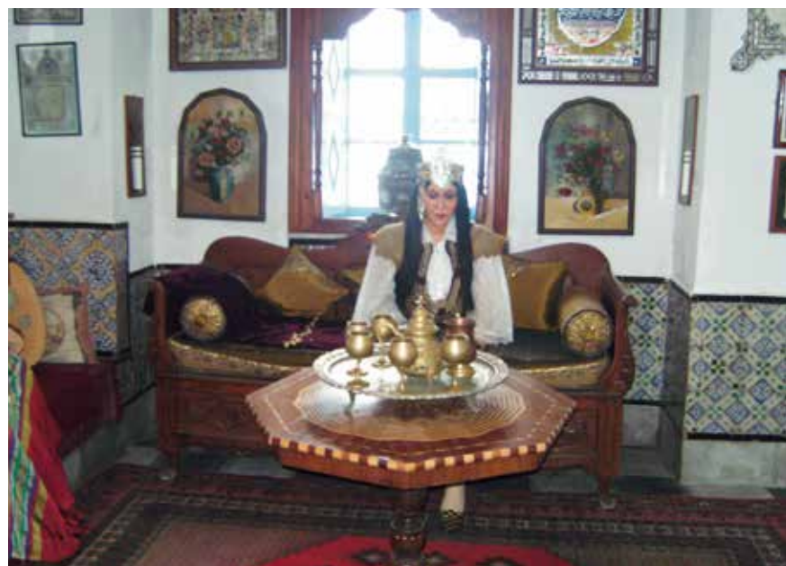
→ Costume traditionnel de fête marocain.

«Nous devons apprendre à vivre ensemble comme des frères, sinon nous allons mourir tous ensemble comme des idiots» Martin Luther-King