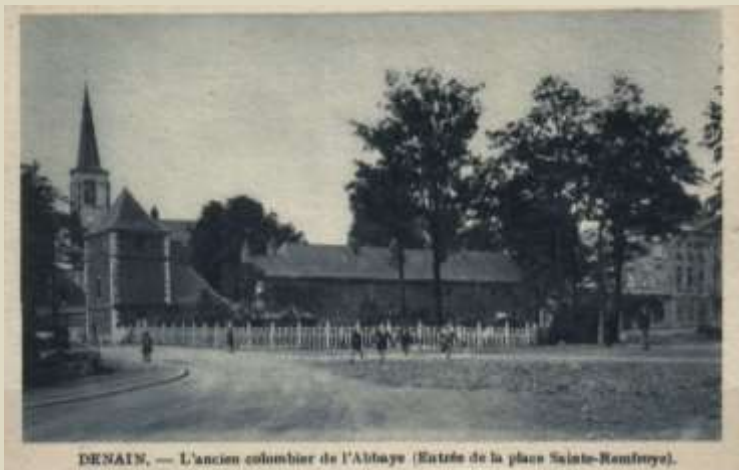
DENAIN. — L'ancien columbier de l'Abbaye (Entrée de la place Sainte-Remfroye).