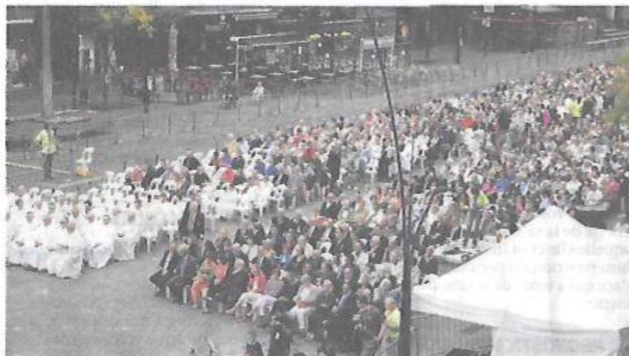
Cette année, la messe aura lieu dans la cour de la caserne Vincent. 2 500 chaises y seront installées. Habituellement, cette messe se déroule place d'Armes.

Les informations sur le pèlerinage sur www.notredamedusaintcordon.fr