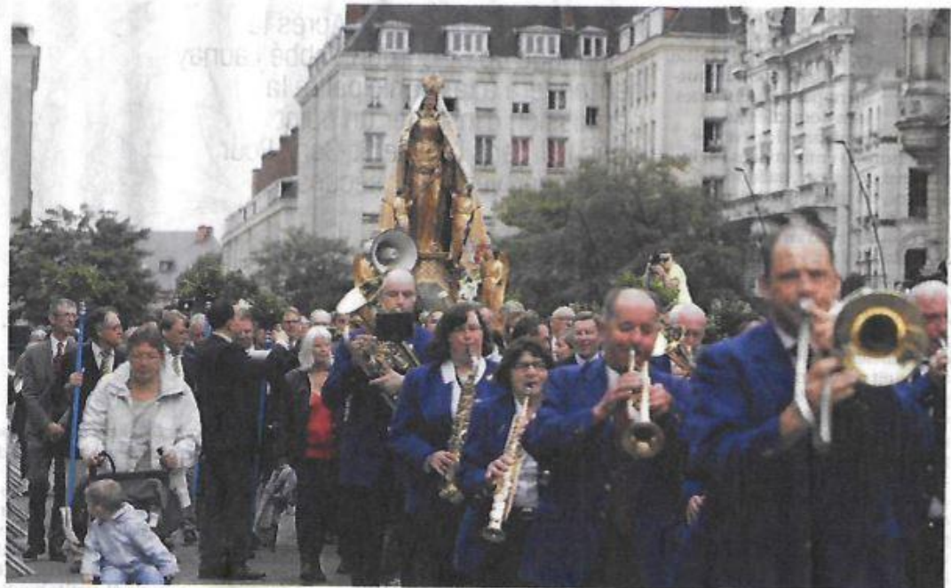
La procession en ville fait son retour cette année, malgré le maintien de l'état d'urgence. La sécurité, tout au long du parcours de 2 km sera optimale. Policiers, militaires et professionnels de la sécurité seront mobilisés.

Un cardinal n'était plus venu à Valenciennes depuis les fêtes du Millénaire (2008 avec le cardinal Danneels, archevêque de Malines-Bruxelles, et 2009 avec le cardinal Ricard, archevêque de Bordeaux). Il existe 223 cardinaux de l'église catholique.