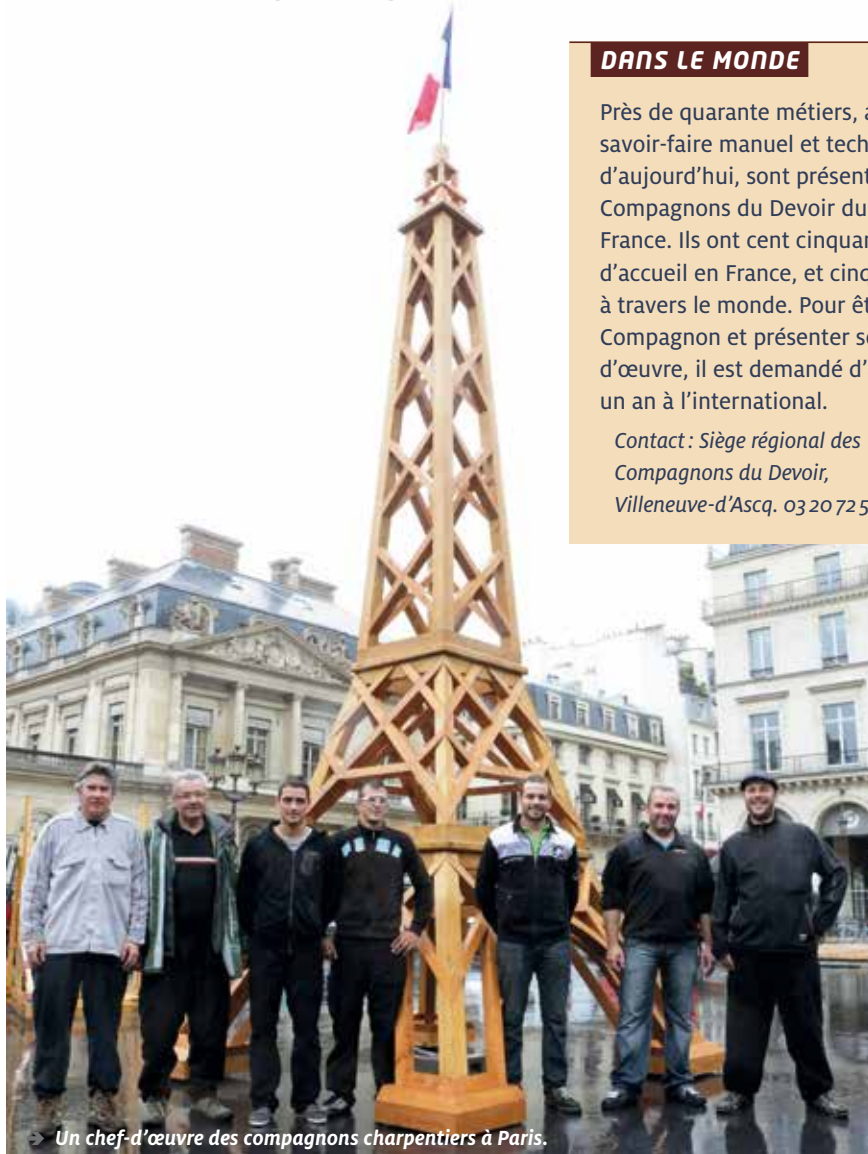
➤ Un chef-d'œuvre des compagnons charpentiers à Paris.