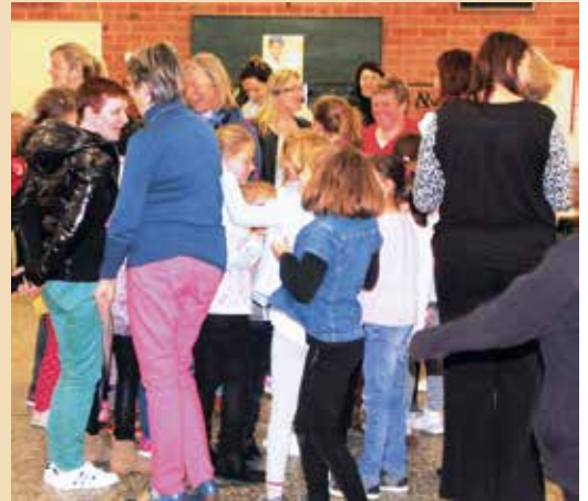
→ Enfants et parents le 5 mai dernier à Saint-Martin.

- vendredi 30 juin de 16h à 19h30 - vendredi 1 er septembre de 16h à 19h30 à la maison paroissiale, 8 place Fénelon. C'est bon d'y penser déjà! Une chance à ne pas manquer!