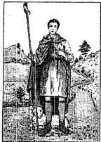
SAINT DRUON PRIEZ POUR NOUS BERGER

à l'occasion de la Saint Druon... ROUCOURT sera en fête le week-end de la Pentecôte... et la Paroisse vous invite à la messe solennelle en l'honneur de Saint Druon