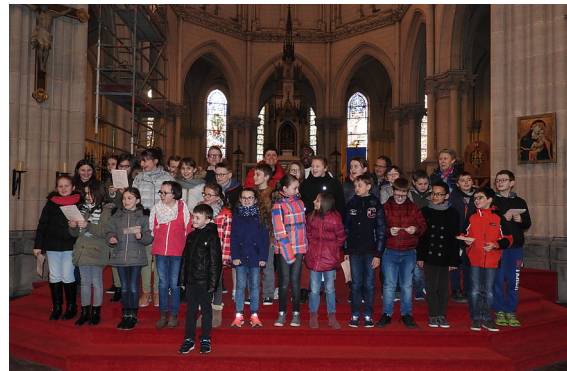
Groupe du 22 mars 2017

« Je veux te dire merci pour tout ce que tu donnes, Merci pour la vie, pour les hommes, Pour chaque instant que tu façannes, Et pour ces gestes qui te nomment, Merci pour ce que tu nous donnes. » (Cf. chant)