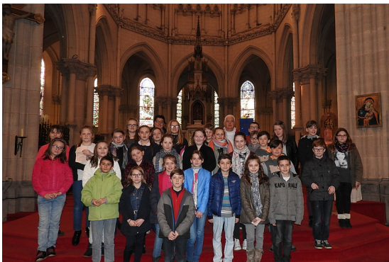
Groupe du 15 mars 2017