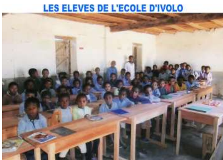
Réfection de l'école d'IVOLO diocèse d'Ambositra