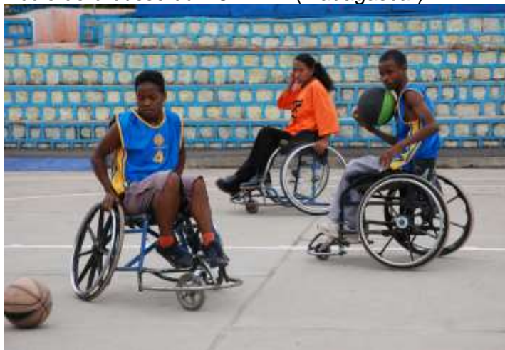
Vive le sport ! Vive le basket au centre des handicapés de Fianarantsoa