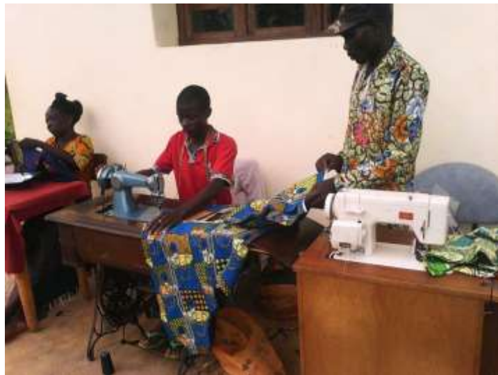
Atelier couture à Sola (RDCongo)