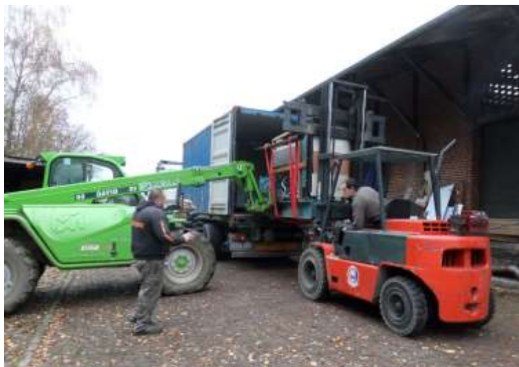
Chargement du groupe électrogène 200 kva