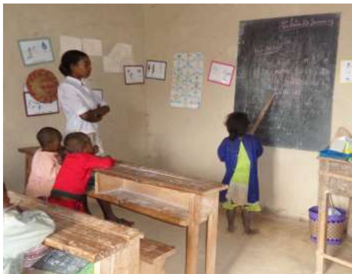
Ecole de brousse du VOZAMA (Madagascar)

Soutenir l'organisation des JNJ (Journées Nationales de la Jeunesse) à Fianarantsoa qui a rassemblé plus de 80.000 personnes en septembre autour des reliques de Ste Thérèse de Lisieux et de ses parents les bienheureux Louis et Zélie Martin.