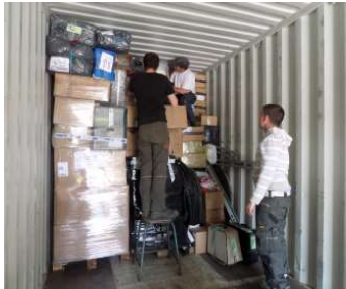
chargement de container