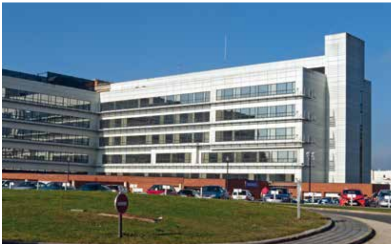
→ Le centre hospitalier de Cambrai.