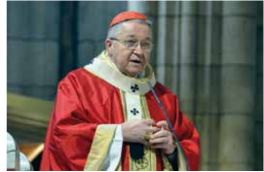
→ Le cardinal Vingt-Trois, archevêque de Paris.

ont échoué, nous réussissons. Protection des murs, protection des frontières, protection du silence. Silence des parents devant leurs enfants à propos des valeurs communes. Silence des élites devant les déviances des mœurs. Silence des votes par l'absentéisme. À quoi bon parler ? Les peurs multiples construisent la peur collective, et la peur enferrme. L'horreur des attentats aveugles vient ajouter à toutes ces menaces. Face aux périls, nous devons nous appuyer sur