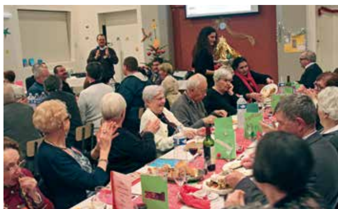
→ En 2015, à la salle Maréchal.

Tout d'abord entre les bénévoles issus des différentes Églises : rencontres qui nous permettent de mieux nous connaître, de mieux nous comprendre, de travailler ensemble dans le respect de nos différences, de vivre un temps de partage et de service. Rencontre aussi de ceux qui, chaque année, souhaitent nous aider (commerçants, chauffeurs, services municipaux, élèves...). Rencontre bien sûr des personnes qui acceptent notre invitation : visite préalable à leur domicile, temps de convivialité pendant la soirée où les participants échangent, chantent, font preuve de solidarité, visite ultérieure avec apport de photos souvenirs.