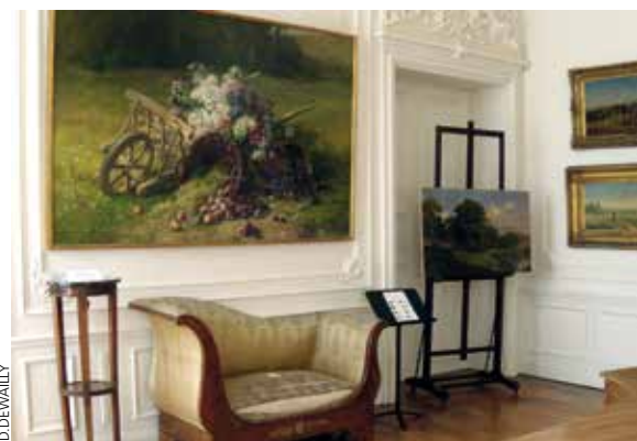
→ Une salle du Musée de Cambrai.