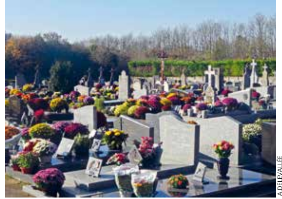
→ Au cimetière de Sainte-Olle, en 2015.

voles constatent que cette démarche est appréciée et souhaitée par la plupart des familles. Sur le feuillet qui est donné, les heures des messes de Toussaint et du jour des défunts sont rappelées. La prière y trouve sa dimension communautaire. Ces rencontres se font sur dix cimetières avec une présence à une trentaine d'entrées, ce qui implique plus de deux cent cinquante personnes dans cet accueil. Depuis 2015, des photophores sont proposés. C'est un signe d'espérance qui, la nuit venue, installe la lumière dans les cimetières. Les paroissiens reçoivent un très bon