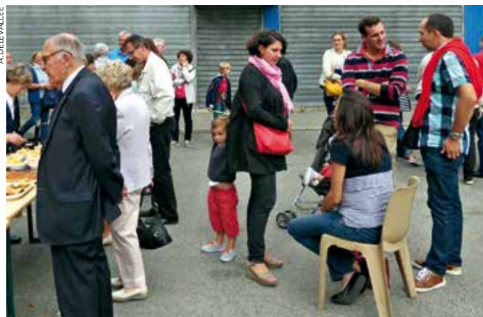
G. D. → À la fête de la paroisse

L'origine latine du mot «rencontre» évoque quant à elle : aller au-devant. La culture de la rencontre nous permet des relations personnelles, qui nous font du bien. Rencontrer, c'est vivre !