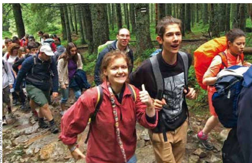
→ Dans les montagnes de Pologne.

PROPOS RECUEILLIS AUPRÈS DE CLOTHILDE, PAR J.-C. CHEVALIER