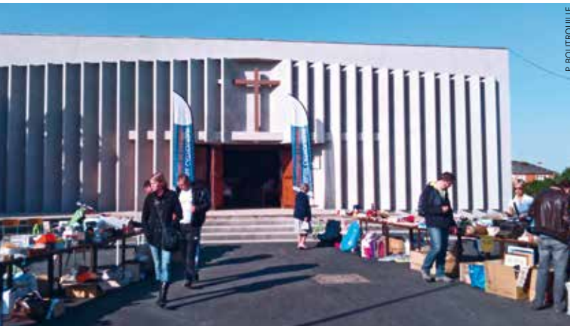
→ Sur le parvis, le jour de la brocante.

Consulter aussi «Conférence des évêques Elections», une déclaration du 20 juin 2016 ainsi que «2017, année électorale, quelques éléments de réflexion».