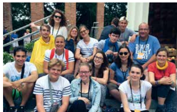
→ Un moment de pause.

but, Cracovie. De voir autant de pays représentés par les jeunes en communion avec le Christ, d'entendre deux millions de jeunes qui chantent d'une seule voix la miséricorde, l'amour et la paix, nous a fort impressionnés. Lors des célébrations, le pape François nous a demandé de former un pont en