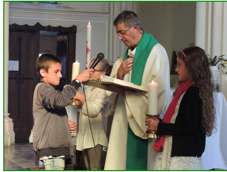
Proclamation de l'Évangile