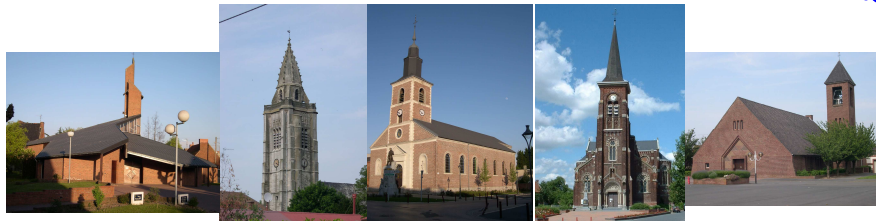
Absson Escaudain Lourches Neuville Roelx