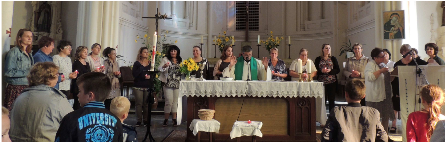
Prière et envoi en mission des catéchistes