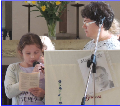
Lecture du psaume