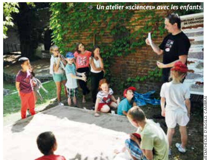
→ Un atelier «sciences» avec les enfants.

Avec moins de rayonnages et plus de confort, avec un service des collections patrimoniales fonctionnel et plus visible, les «richesses» cambrésiennes seront valorisées. La médiathèque