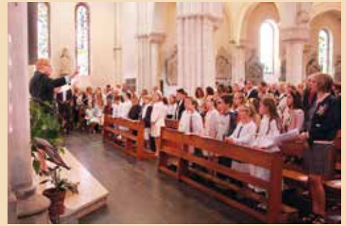
→ Messe de première communion à l'église de l'Immaculée.

Le 17 septembre à 18 heures à l'église Saint-Jean, tous les jeunes du primaire et leurs familles sont invités pour une célébration festive ! Il est temps de s'inscrire au catéchisme : pour les enfants en CE2 ou nés en 2008, ou au-dessus ! Découvrir Jésus et l'Évangile n'est pas un luxe au XXI e siècle ! Chaque année, les enfants qui n'ont pas reçu le baptême peuvent s'y préparer. Contact : Maison paroissiale, place Fénelon 03 27 81 87 11.