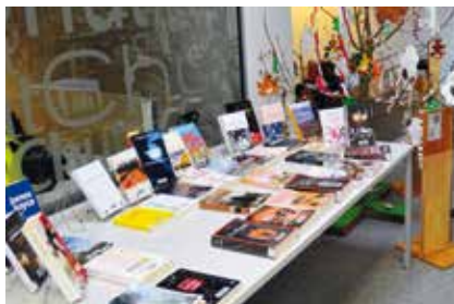
→ Médiathèque de Proville.

Courtes ou longues, parfois elles collent au texte, parfois le rythme entre sens et écriture déraile, on ne sait plus où on est. Ou encore, on a l'impression de partir dans deux directions opposées. Là, poser le livre, le reprendre plus tard, ou définitivement l'abandonner. Un livre, on peut le lâcher, s'il n'est pas à la hauteur de ce qu'on en attendait. Un passionné a toujours une pile de livres auprès de lui, au cas où. Ne jamais n'avoir rien à lire ! Garder toujours une poire pour la soif, un roman jamais lu, une revue périmée, un guide de voyage, un livre de poésie, qui peut s'apprendre par cœur. Aimer lire, c'est dévorant, et la passion devient servitude. Si les yeux n'ont pas eu leur «content» de mots, de phrases avalées, on lit n'importe quoi : une recette de cuisine, une notice d'utilisation d'un produit !