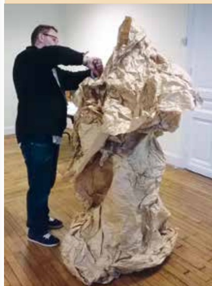
→ L'artiste travaille «Anna», papier froissé.

1. 7 rue du Paon - Cambrai Tél. : 06 83 57 32 71