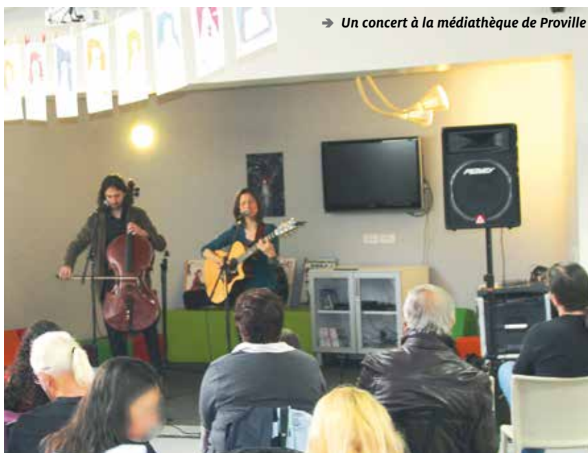
→ Un concert à la médiathèque de Proville