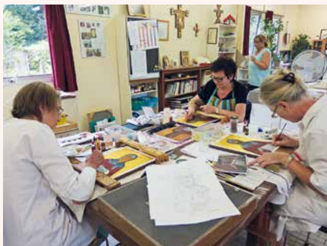
→ Un atelier d'icônes.