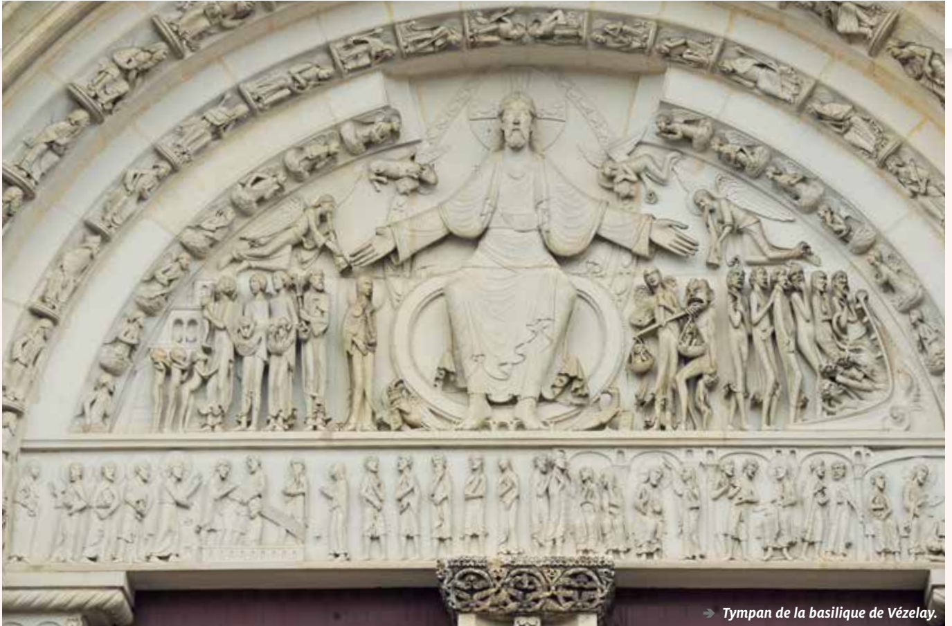
→ Tympan de la basilique de Vézelay.

Dieu est un artiste – la nature est un chef d'œuvre ! –, et il nous a transmis ce besoin de créer. Verre, métal, pierre, stylo, argile, pinceau... à partir de presque rien, on peut réaliser une merveille.