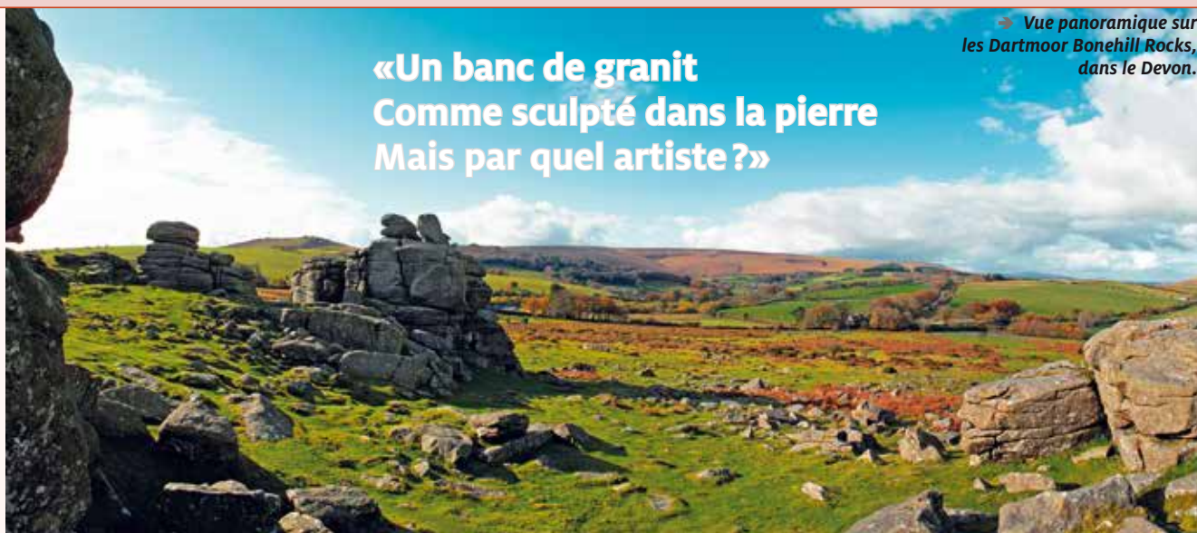
→ Vue panoramique sur les Dartmoor Bonehill Rocks, dans le Devon.

«Un banc de granit Comme sculpté dans la pierre Mais par quel artiste?»