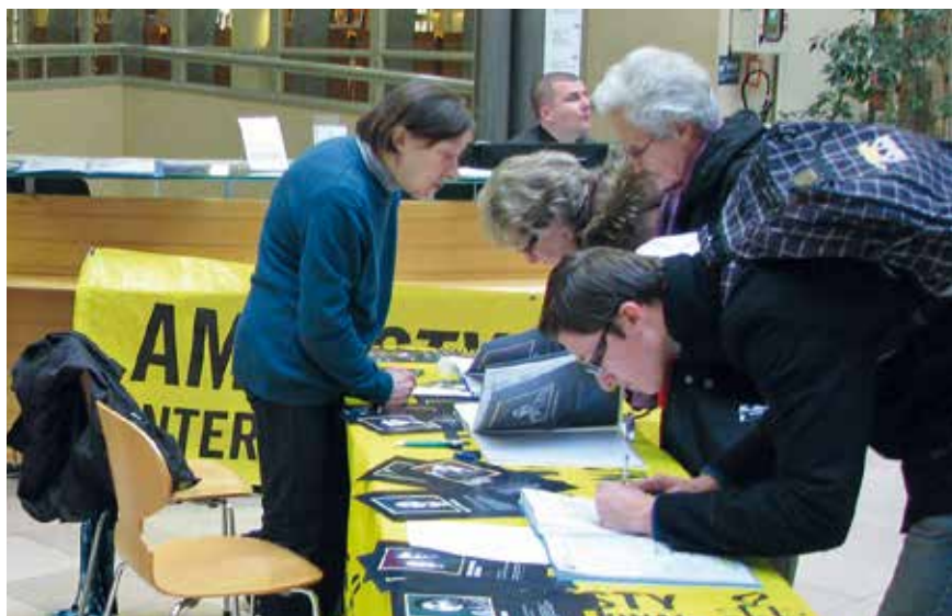
→ Séance de signatures.

À Valenciennes, les militants interviennent dans des établissements scolaires pour promouvoir les droits humains. Ils organisent des manifestations sur la peine de mort (au 10 octobre ou 30 novembre), sur les droits des femmes (8 mars) et surtout sur la DUDH avec la manifestation mondiale des «Dix jours pour signer» qui réunit dans le monde entier, autour du 10 décembre (anniversaire de la DUDH), les sections d'Amnesty International. À chaque fois, le public se voit proposer