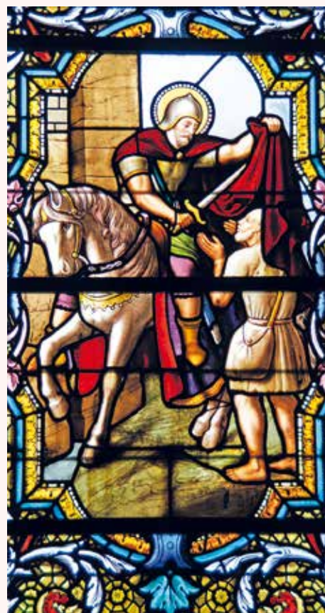
→ Un vitrail représentant saint Martin.