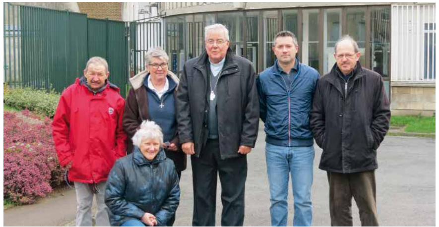
→ L'équipe lors de la visite de notre évêque.

Je veux parler des détenus des prisons ; ces personnes qui sont en détention provisoire dans l'attente, parfois longue, d'une décision de justice. Ces hommes et femmes sont coupés de tous repères de la vie sociale, de