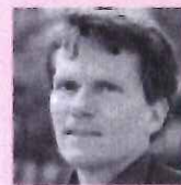
Hartmut Rosa Sociologue et philosophe

Renseignements et inscriptions en ligne :