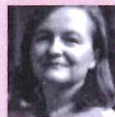
Nathalie Loiseau Directrice de l'École nationale d'administration