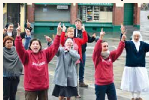
→ Le flash mob.