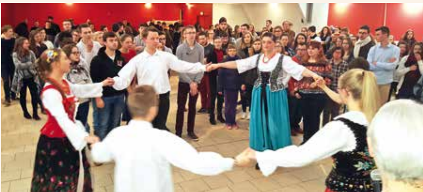
→ Notre Église est vivante.