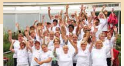
→ La Chorale des P'tits Bonheurs à Valenciennes.

~ Contact : http://laics.cathocambrai.com/festi-frat.html