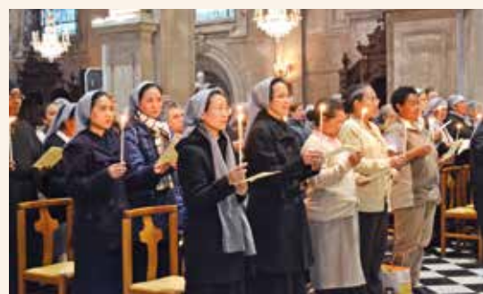
→ Parmi les religieuses, celles venues de Madagascar et du Vietnam.

Une centaine de religieuses, de religieux et de laïcs consacrés étaient présents. Après un temps d'accueil dans la joie, une célébration poursuit la matinée.