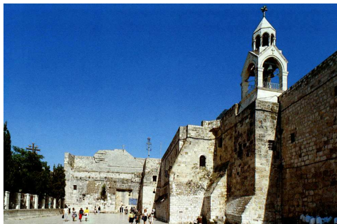
Basilique de la Nativité

Retour à Bethleem et visite de la Basilique , construite sur la grotte de la Nativité de Jésus.