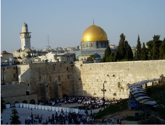
Vue sur le mur Occidental

Après le petit déjeuner, départ vers le mont du Temple, et visite du Mur Occidental dit des « Lamentations ». ensuite montée sur l'esplanade Al-Haram Al-Sharif, troisième lieu saint de l'Islam et visite extérieure de la mosquée Al-Aqsa et le Dôme du Rocher.