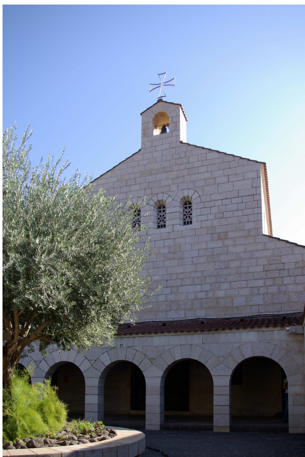
Eglise de la Multiplication