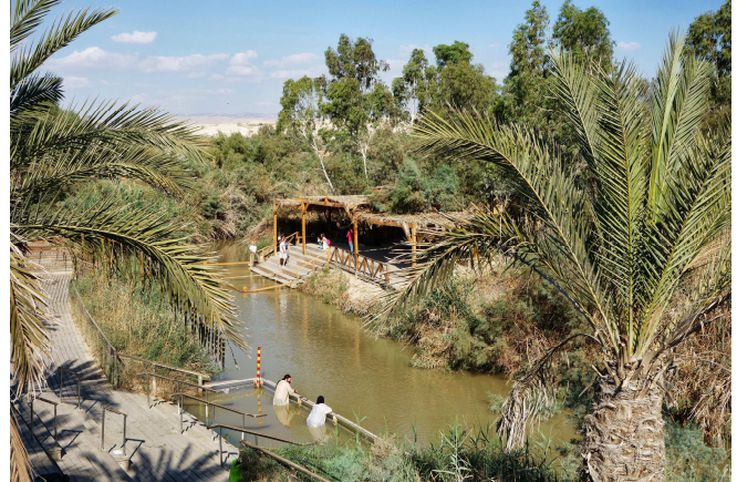
Qasr El Yahud

Visite du site de Qasr El Yahud sur le bord du Jourdain.