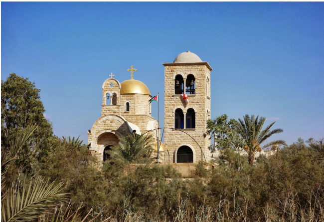
Qasr El Yahud