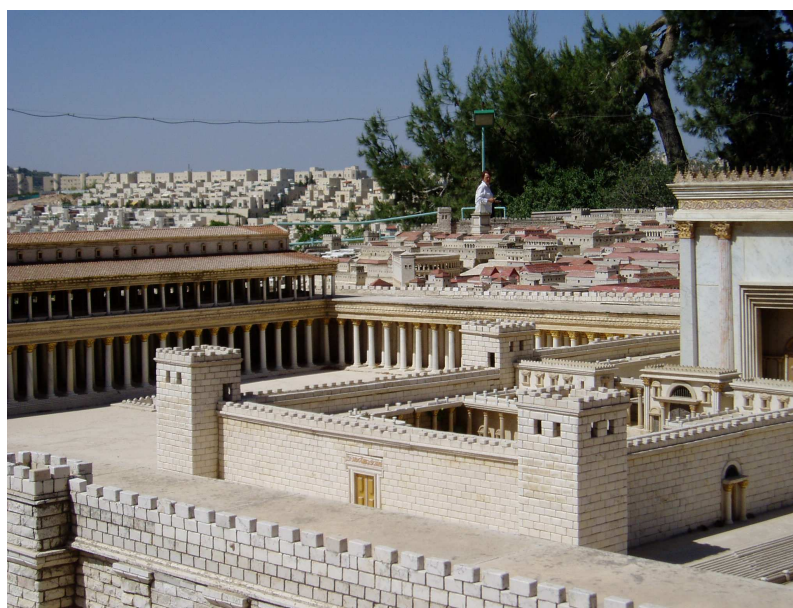
Maquette de la ville

Puis visite de la maquette de la ville de Jérusalem du temps du Christ.