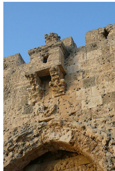
Porte des Lions

Déjeuner à l' « Ecce Homo » /Lithostrotos.