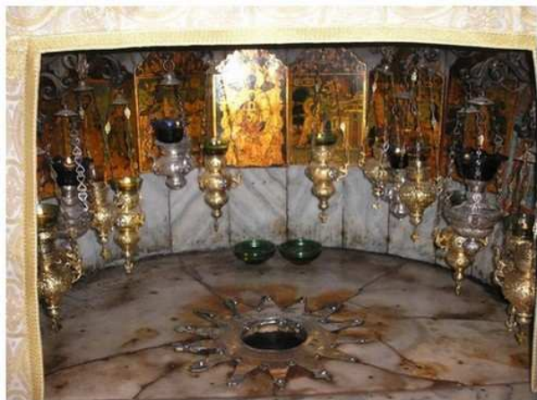
Grotte de la Nativité

Célébration de la messe au Champ des Bergers.