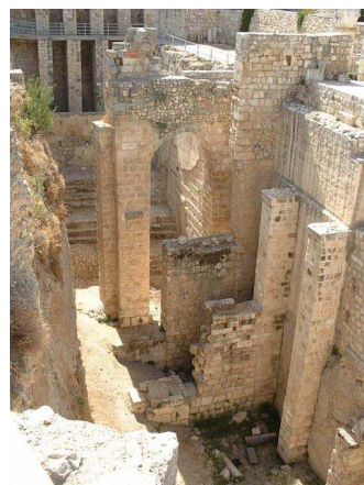
Piscine de Bethesda

Déjeuner au restaurant Askadinya ou à l'hôtel Notre-Dame.