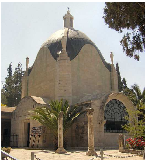
la chapelle du Dominus Flevit