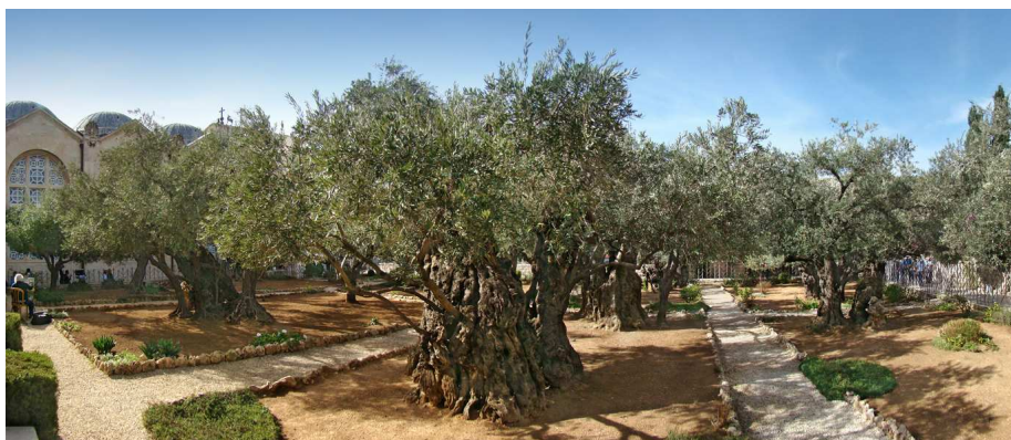
Le jardin de Gethsémani

Ensuite, temps de méditation sur la Passion du Christ et marche vers la Basilique de la Résurrection ( St. Sépulcre).