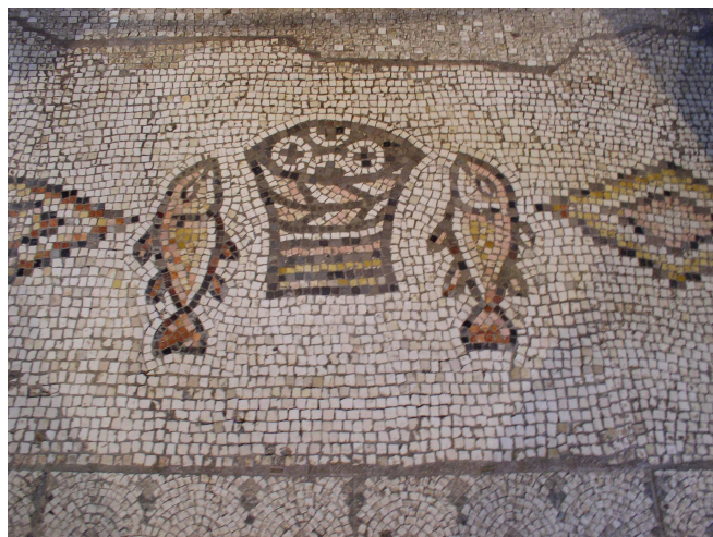
Mosaïque des pains et des poissons