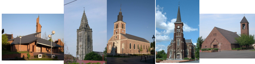
Absson Escaudain Louches Neuville Roelx