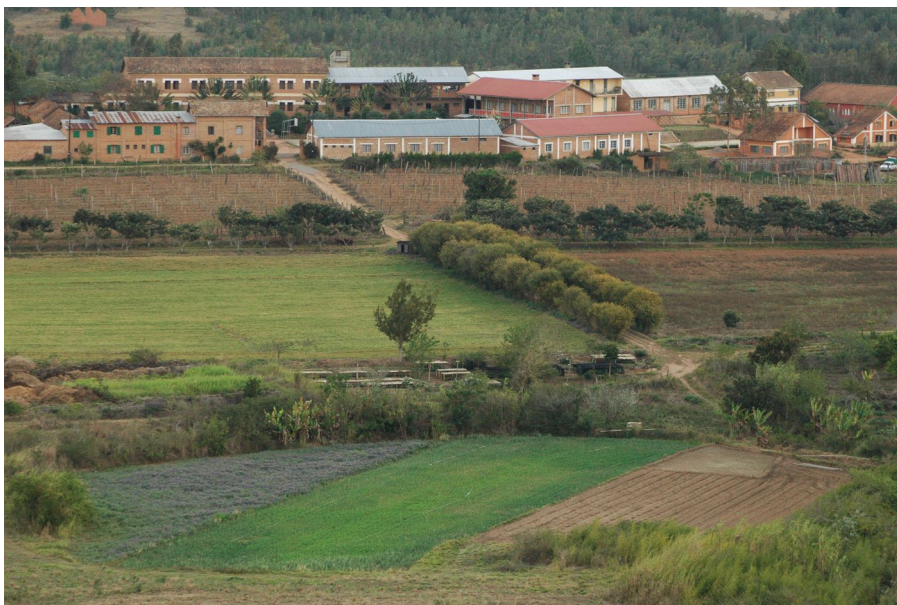
Les bâtiments de la ferme entourés des champs

La ferme école d'Andriamboasary se situe en terre Betsileo, dans la région des Hautes-Terres. Ici, la campagne, ou brousse est fortement peuplée et la pression démographique croissante. Malheureusement, les pratiques agricoles actuelles ne permettent pas de nourrir cette population croissante. C'est dans ce contexte que, depuis 1950, le CFR, qui dépend du diocèse de Fianarantsoa, accompagne et forme les paysans de la région à valoriser au mieux leur terre et leur travail, et à trouver d'autres sources de revenu agricole.