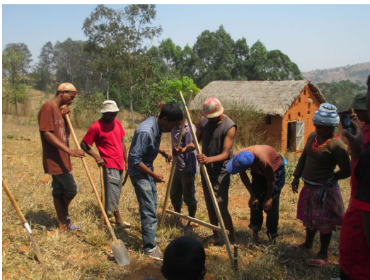
Comment creuser un canal d'irrigation plan ?

L'objectif de la ferme école est de proposer un cycle de 10 modules par an à bas prix pour les agriculteurs locaux.