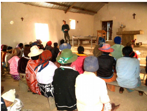
Premier discours en malgache, devant un auditoire de parents d'élèves