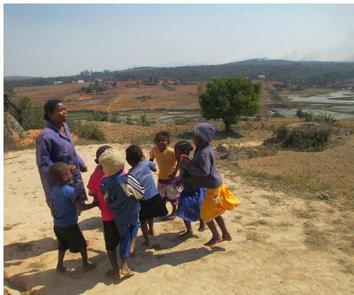
Jeux et rondes dans un des 700 postes

Par ailleurs, le VOZAMA a développé d'autres actions en vue d'aider les zones enclavées à se