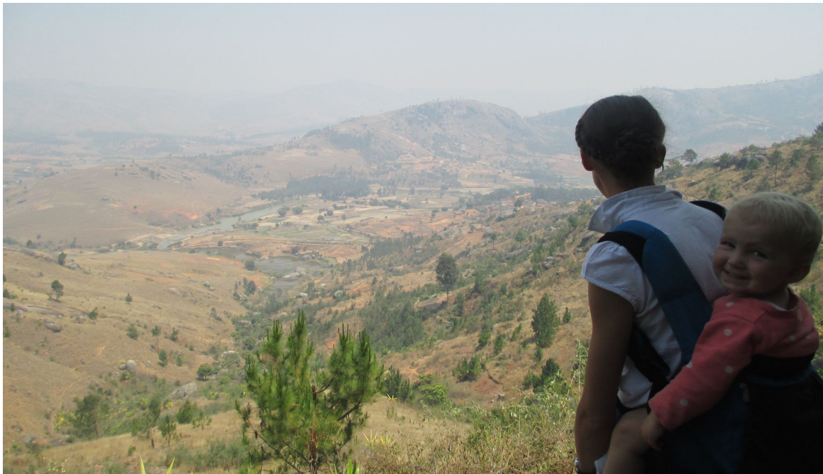
Découverte des paysages de collines déboisées (tanety) de la région betsileo

nous attend pour faire les 400 km qui séparent la capitale de Fianarantsoa. Ainsi nous avons pu bénéficier d'un minibus juste pour nous et d'un chauffeur habitué. Derrière la vitre, c'est un autre monde. Un autre monde à découvrir, à aimer. Des voitures toutes cabossées qui roulent de partout, des petits vendeurs sur le trottoir, des gens pieds nus partout, de la saleté dans la capitale, mais de la vie grouillante et jeune. Nous quittons assez rapidement la ville pour découvrir la campagne, très sèche, vallonnée, et la route sinueuse et en très mauvais état. Le long de cette RN7 (d'ailleurs un des axes principaux du pays), nous croisons de très nombreuses personnes qui marchent, portent des choses sur leur tête. Aussi beaucoup de zébus dans les rizières asséchées dans lesquelles sont cultivés des légumes à contre-saison. Après 10 heures de route pendant lesquelles les enfants ont été plutôt sages, nous arrivons à Fianarantsoa dans la nuit. Mamivola nous dépose dans notre maison et là, les coopérants français de la ville nous accueillent. Une banderole « Tonga soa » (Bienvenus) nous attend avec le repas du soir et une brioche pour le matin ! Les enfants se couchent non sans pleurer à cause du stress de la moustiquaire au dessus de leur lit... nous répondons que c'est une cabane ! Il y eu un soir, il y eu un matin, ce fut la première de nos 730 journées malgaches !