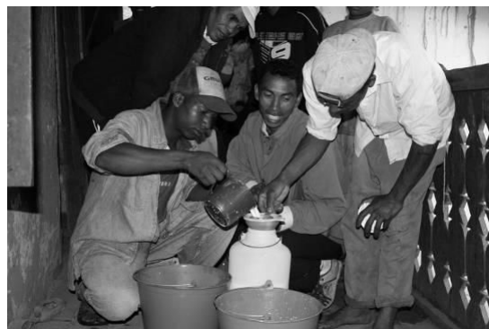
Les collectés apportant le lait vers 6h du matin

Depuis 2007, le centre encourage le développement de la filière lait dans la région. Les paysans ont donc la possibilité d'acheter à crédit des vaches laitières de bon niveau génétique s'ils respectent les engagements suivants : avoir les connaissances nécessaires sur l'élevage bovin, posséder une surface fourragère suffisante pour nourrir les vaches, construire une étable saine, etc... et apporter leur lait au centre de collecte. Deux techniciens de la ferme les suivent et les accompagnent alors, sur tous les aspects de l'élevage. Actuellement 70 agriculteurs livrent du lait tous les matins (ces agriculteurs peuvent faire jusqu'à 1h30 de route à pied pour amener le lait!)