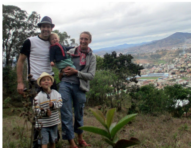
La famille sur les hauteurs de Fianarantsoa

Nos missions sont passionnantes et nous prennent beaucoup de temps. A suivre !