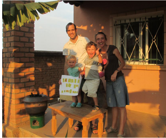
Ensemble devant notre maison