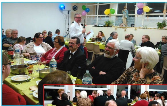
Repas fraternel du réveillon du 31 décembre à la salle J.Delaporte à Neuville