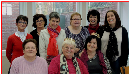
Galette des catéchistes de la paroisse