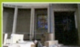
P.6 Travaux de l'église saint Pierre saint Paul : Où en est-on ?