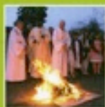
P.2 Les célébrations de Pâques