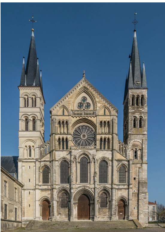
Basilique St Rémi

Dîner puis temps personnel, promenade pour ceux qui le désirent.