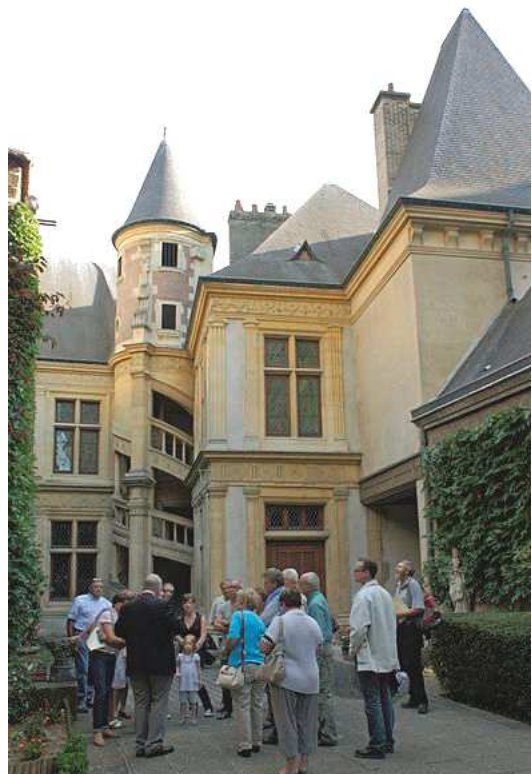
Maison natale de St Jean-Baptiste de La Salle