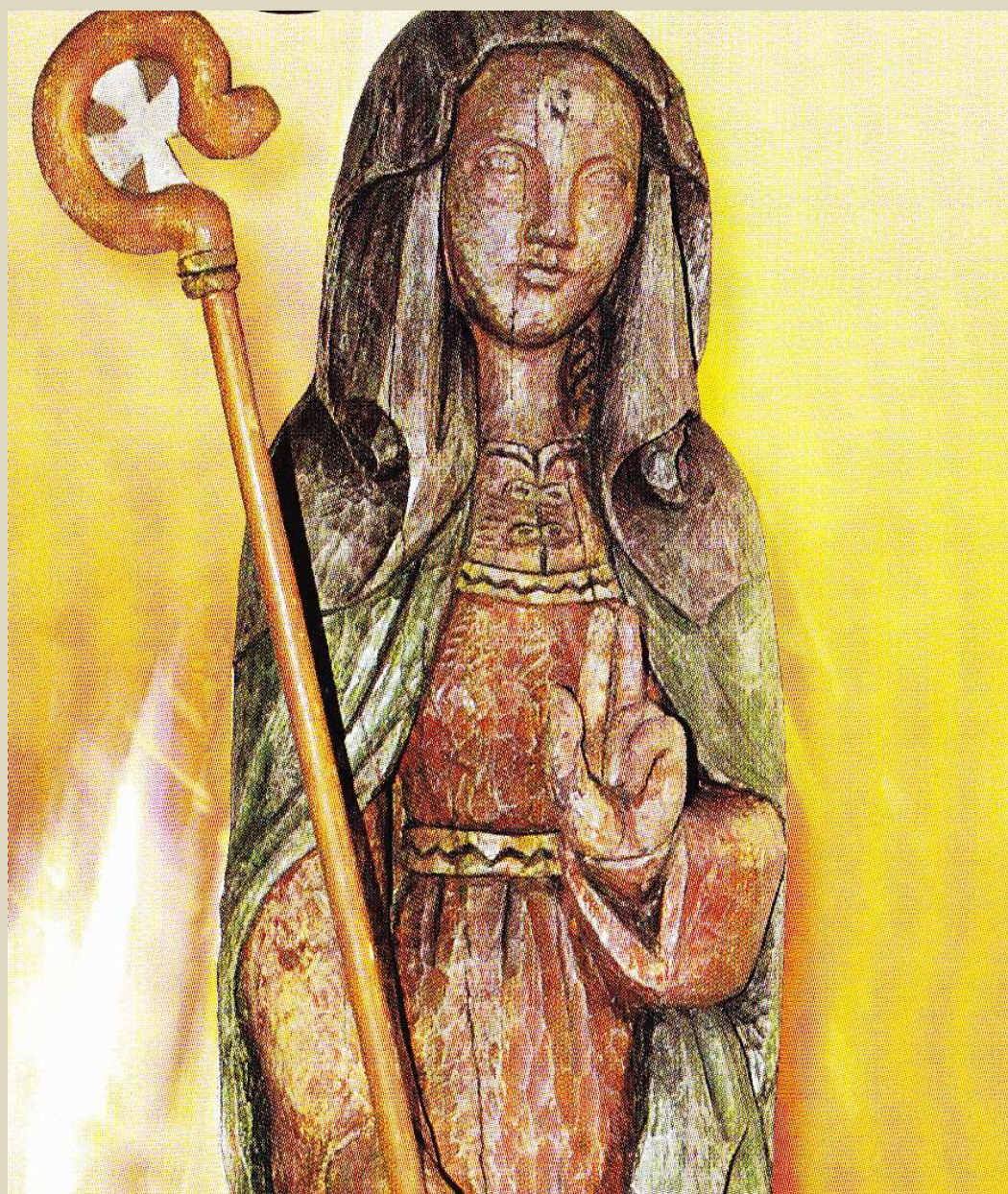
Sainte Remfroye, Abbesse, patronne de Denain