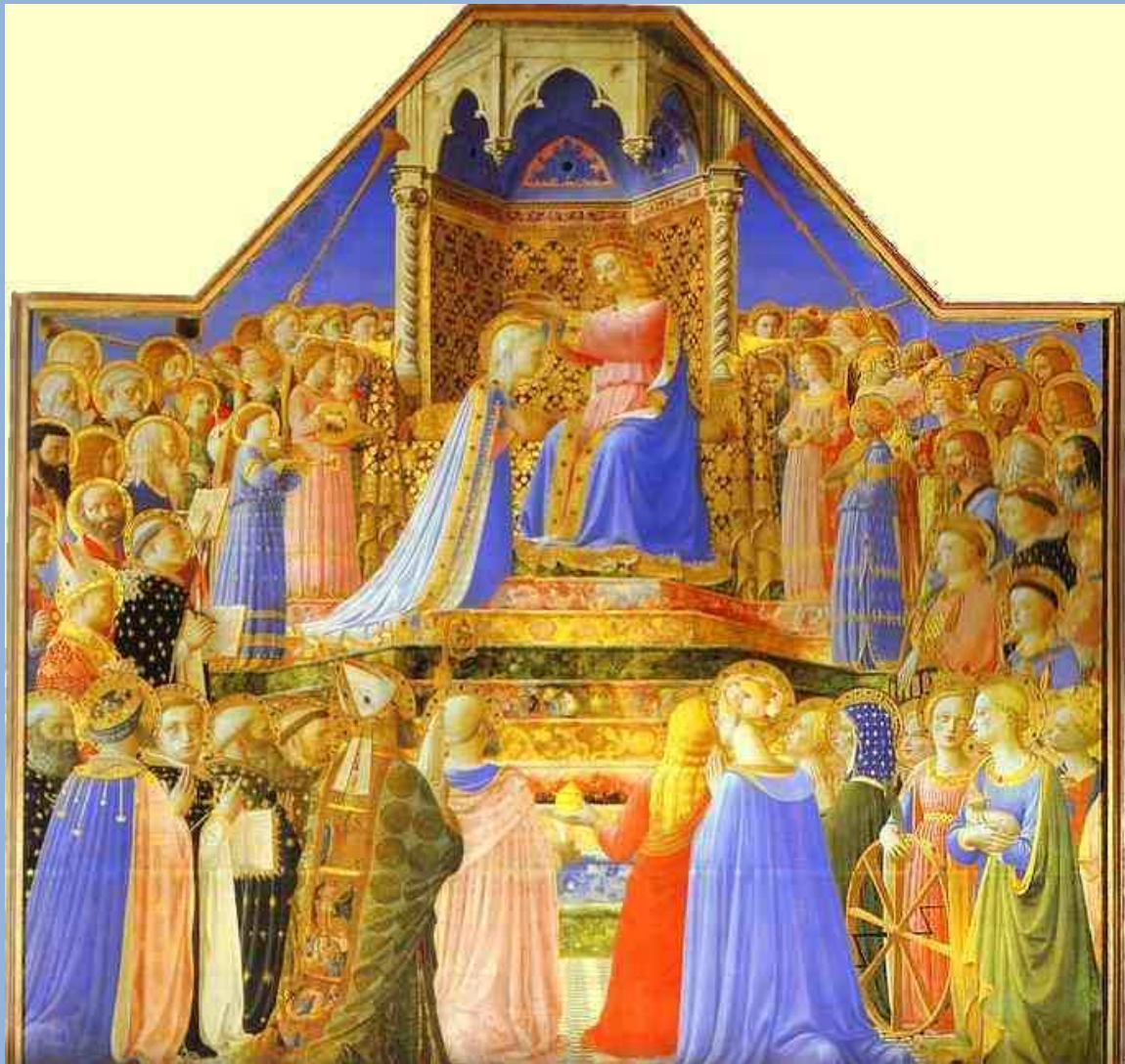
Fra Angelico. Le Couronnement de la Vierge